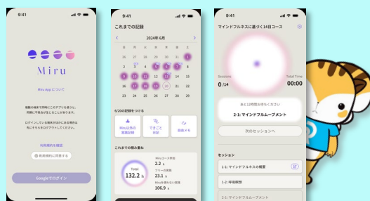
瞑想アプリ「Miru」の画面デザイン

さらに、瞑想が効果を持つものであるのかどうかを検証するために、様々な効果検証実験を川島先生や諸先生がたと一緒に実施して参りました。