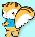
立正大学マスコット キャラクターモウリス